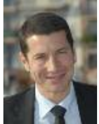
Bernard Brochand Député-maire de Cannes

Au bonheur des planches. Le Palais des Festivals et des Congrès de Cannes est devenu une locomotive économique et sociale. Il est aussi une locomotive culturelle ! Qui vous emmène en voyage, le plus beau, le plus initiatique, le plus stimulant : celui des arts.