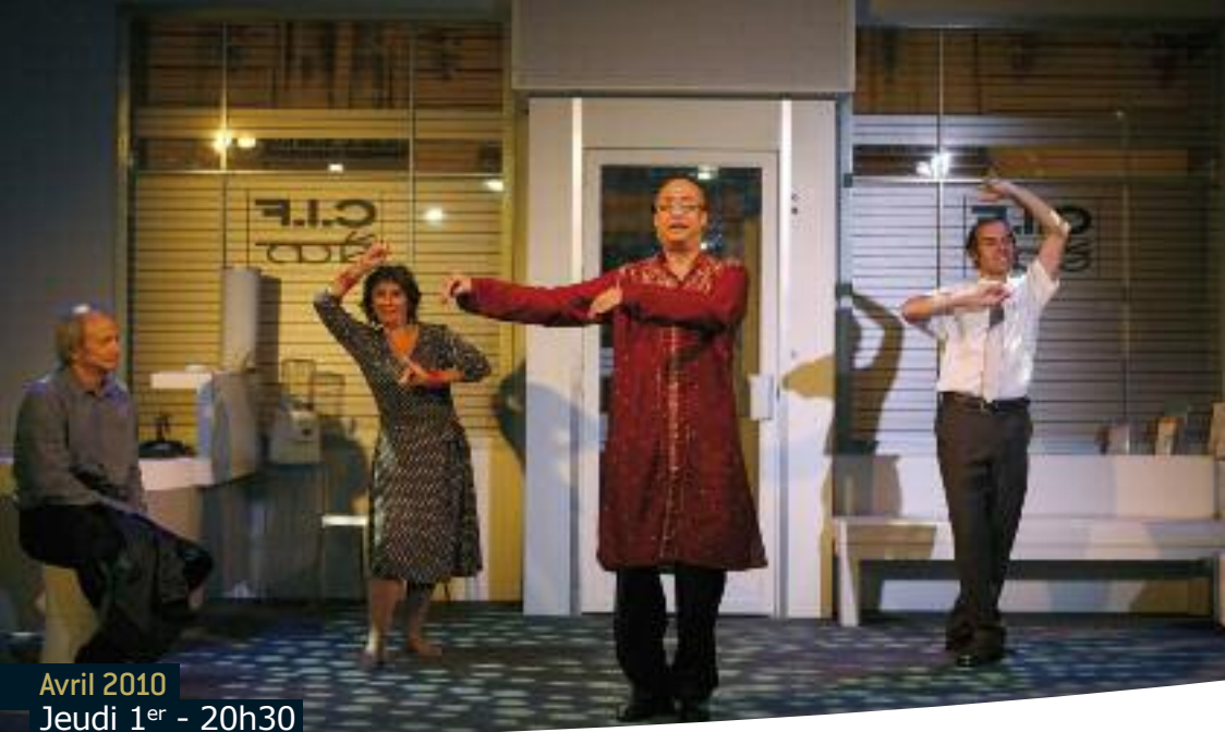
Avril 2010 Jeudi 1 er - 20h30